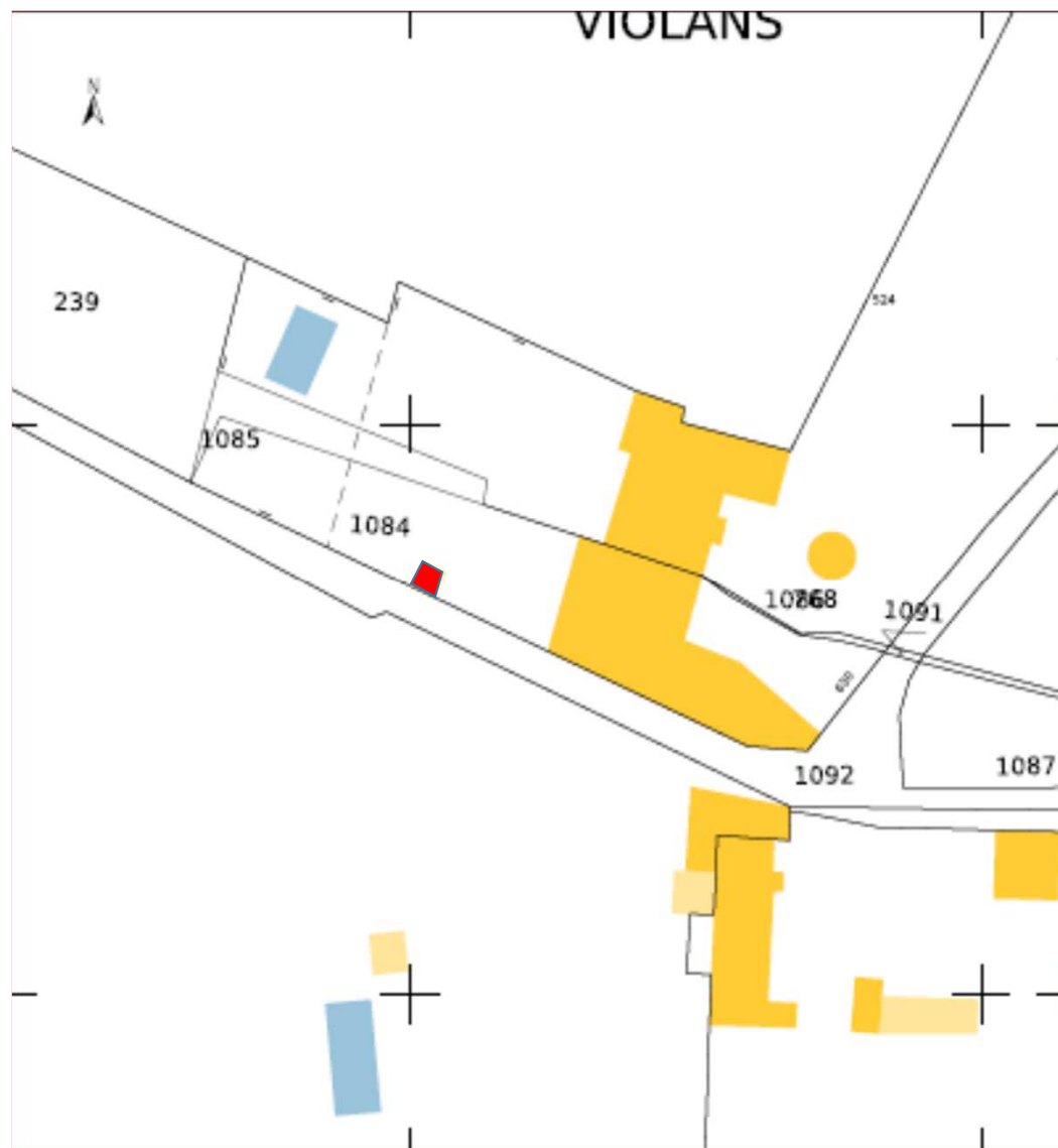
CHASSE-SUR-RHONE (38) Pavillon Falconnier Limite de la protection au titre des monuments historiques figurée en rouge